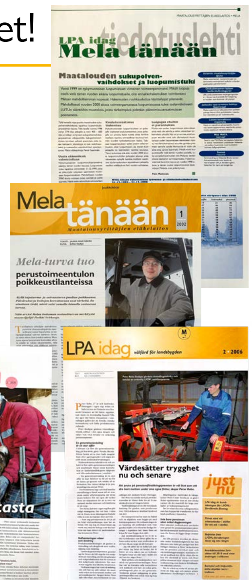
LPA idag genom åren.