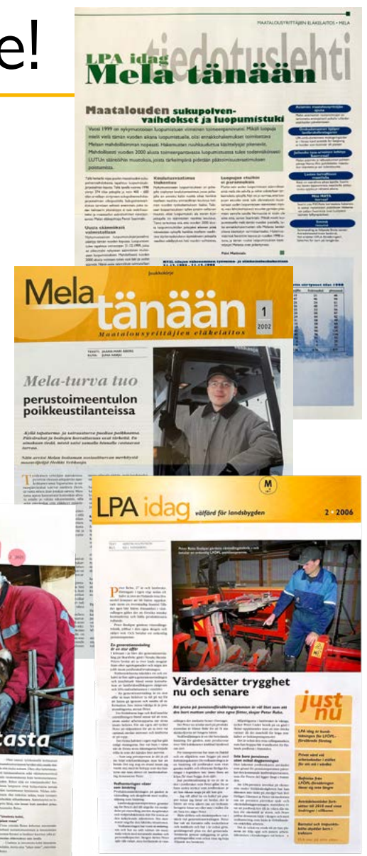
Mela tänään -lehtiä vuosien varrelta